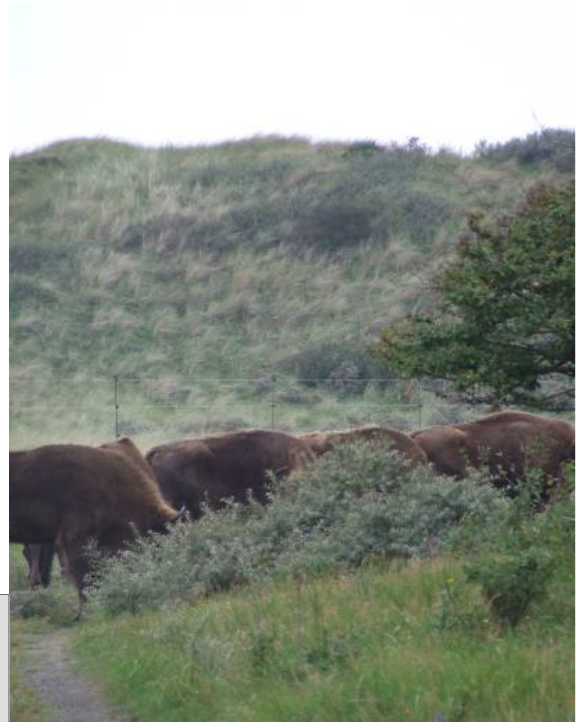
Foto 9 Ruggen op een rijtje (L. Veldhoen, 27-08-08) Enkele ruggen op een rijtje. Tijdens het grazen blijven ze vaak dichtbij elkaar.