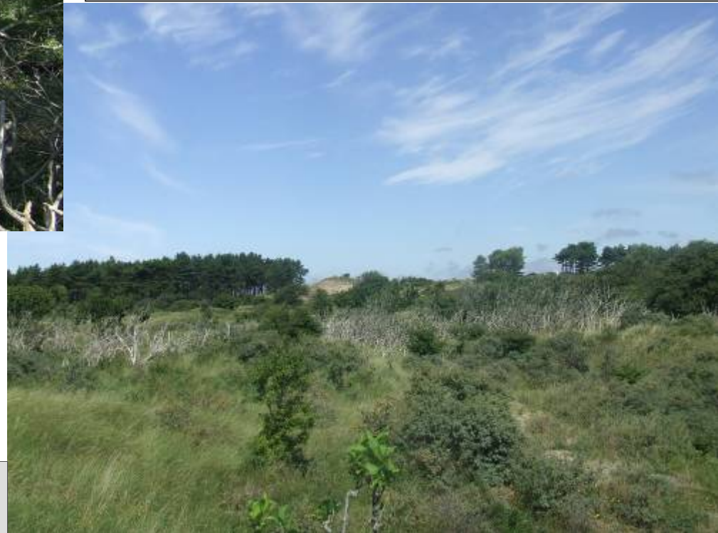
Foto 2 Het effect van schillen op afstand (L. Veldhoen, 06-08-08)