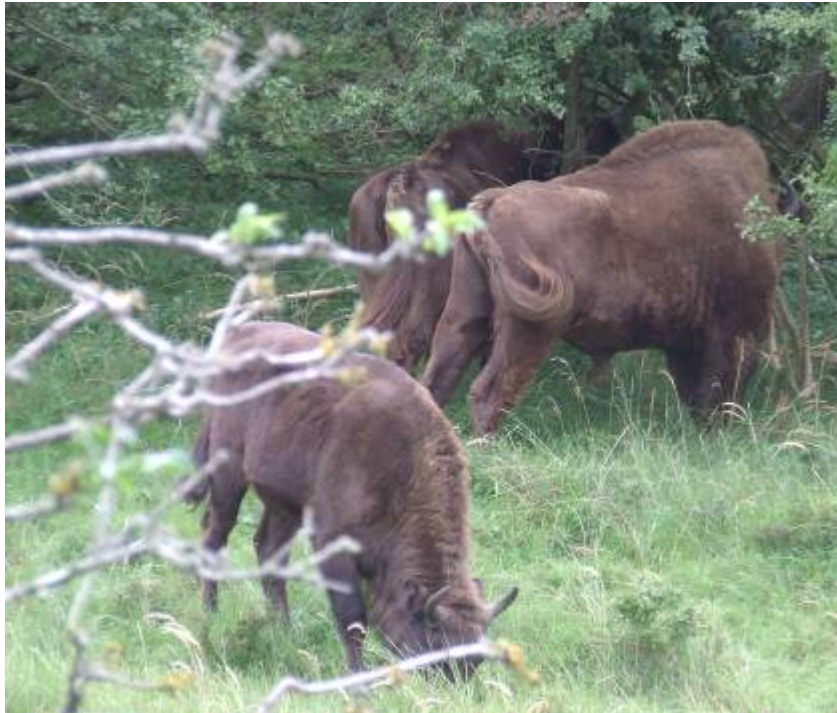
Foto 16 & 17 Stier en Moeder aan de Kardinaalsmuts (R.Normann 04-09-08)

Hier zien we Stier browsend aan een Kardinaalsmuts, wat een van het meest geliefde voedsel lijkt te zijn.