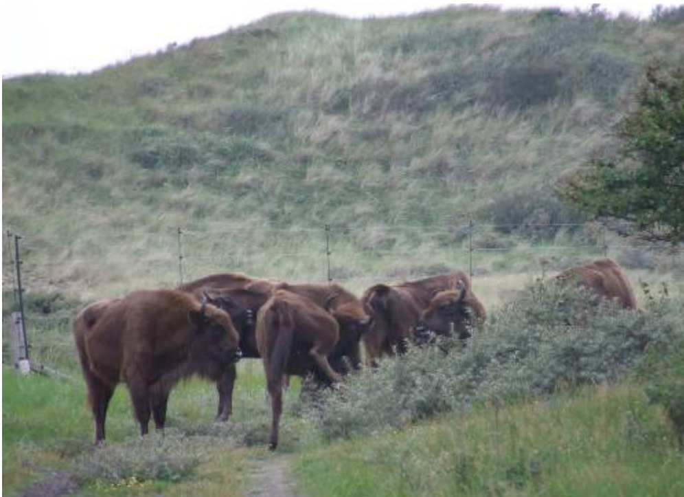
Foto 8 Drie poetsende wisenten op een rijtje (L. Veldhoen, 27-08-08) Leer van de wisenten: Lenig blijf je door je regelmatig goed te poetsen.