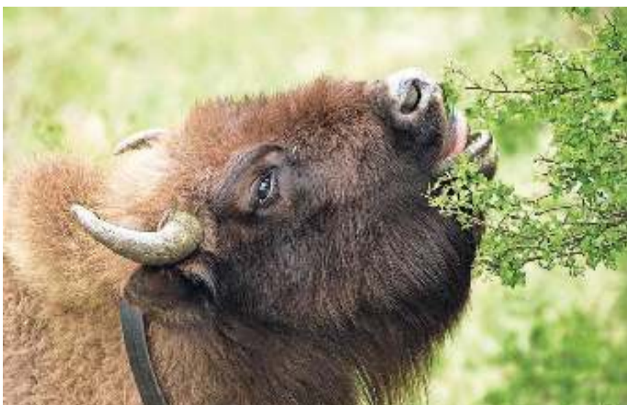
Wisent neemt een hap meidoorn.