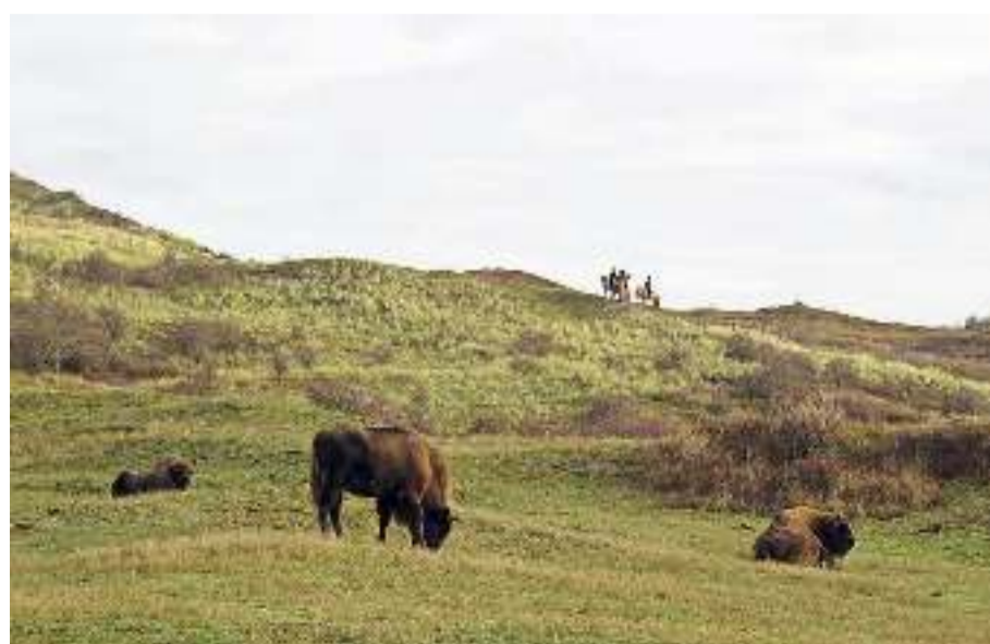
Ruiters op het duin in het wisentengebied